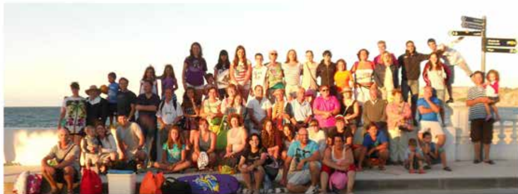
10-8-13: Excursión a Comillas