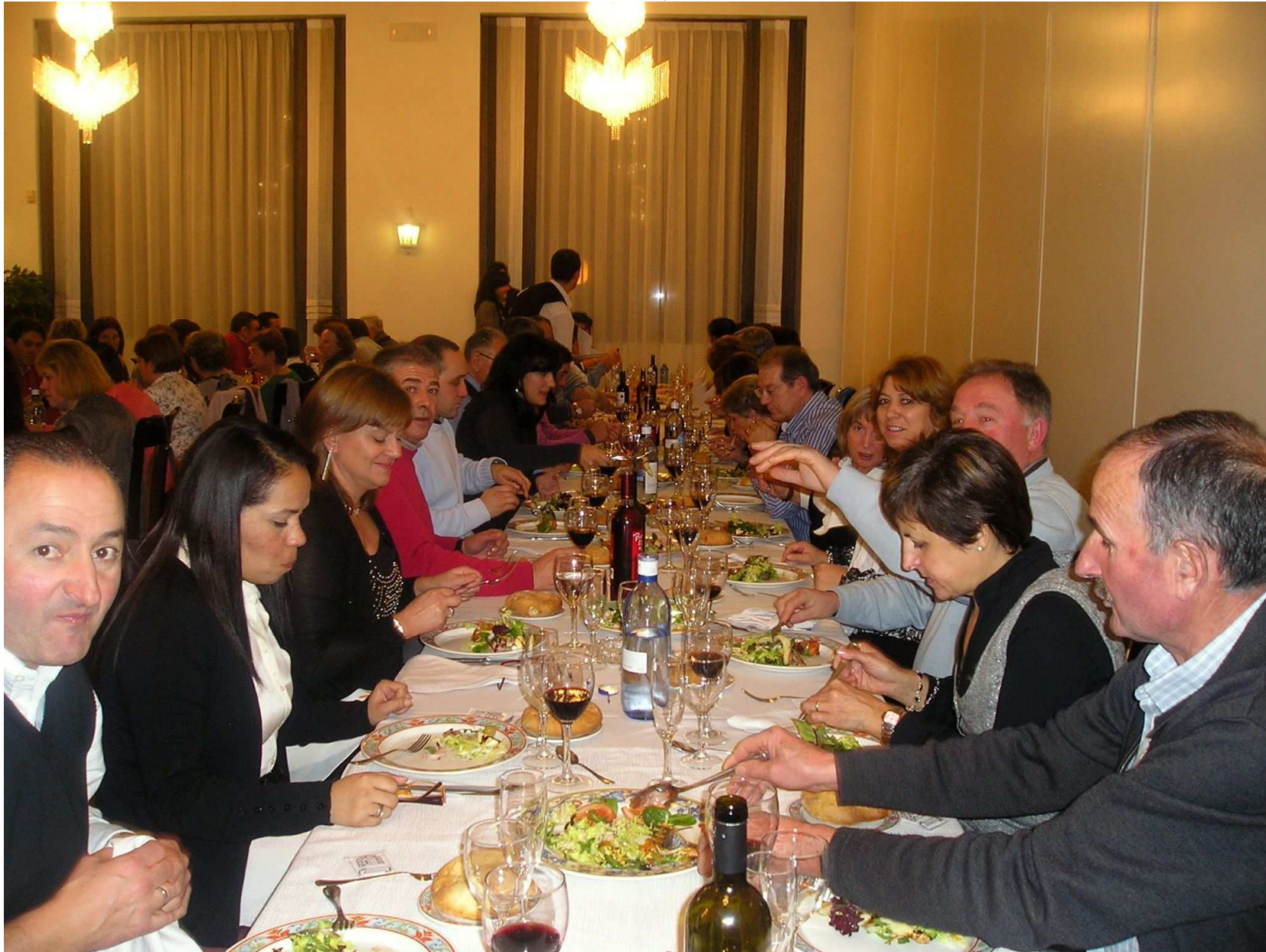
ASOCIACIONES CULTURALES DE ARENILLAS DE MUÑO: A.C. SAN ESTEBAN, BUNIEL: A.C. LOS TURMÓDIGOS, CAVIA: A.C. RIOCAVIA, MAZUELO DE MUÑO: PEÑA LOS TOMIJEROS Y QUINTANILLA SOMUÑO: A.C. GRAN KAN DE MUÑO